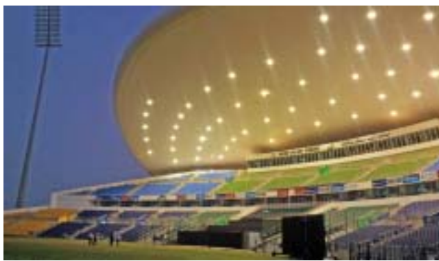
ഇനി ഇവിടെ ആത്മീയശബ്ദം: അബുദബി ക്രിക്കറ്റ് സ്റ്റേഡിയം.

അബുദബി: ഗൾഫിലെ ക്രൈസ്തവ ചരിത്രത്തിനു പുതിയ അധ്യായം കുറച്ചുകൊണ്ടു യു. എ. ഇയുടെ തലസ്ഥാനമായ അബുദബിയിലെ ക്രിക്കറ്റ് സ്റ്റേഡിയത്തിൽ ഫെബ്രുവരി 16,17 തീയതികളിൽ 'ഫെസ്റ്റിവൽ ഓഫ് പീസ്' ആത്മീയസമ്മേളനത്തിനു ഒരുക്കങ്ങൾ പൂർത്തിയായി. ലോകത്തിലെ ഏറ്റവും വലിയ പെന്തെക്കോസ്തു സഭയായ സൗത്ത് കൊറിയ യോഗിഡോ ഫുൾ ഗോസ്പൽ ചർച്ച് സീനിയർ പാസ്റ്റർ ഡേവിഡ് യോഗിച്ചോ പ്രസംഗിക്കും. യോഗിച്ചോയോടൊപ്പം ആറംഗസംഘവും പതിനാറിന് അബുദബിയിലെത്തും.