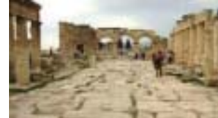
ഫിലിപ്പോസിന്റെ ശവകുടീരം കണ്ടെത്തിയെന്ന് പറയുന്ന സ്ഥലം.

ഫ്രാങ്ക്ഫർട്ട്: ക്രിസ്തു ശിഷ്യൻ ഫിലിപ്പോസിന്റെ ശവകുടീരം ടർക്കിയിലെ പമുക്കൈലക്കടുത്ത് ഹെറാപ്പോളിസ് അവശിഷ്ടങ്ങൾക്കിടയിൽനിന്നും കഴിഞ്ഞു തുടങ്ങിയ ഒരു അന്വേഷണത്തിൽ സംഘം അവകാശപ്പെട്ടു. ഇറ്റലി, ഫ്രാൻസ്, ജർമ്മനി, നോർവേ, എന്നീ രാജ്യങ്ങളിൽ നിന്നുള്ള വർ ഉൾപ്പെട്ട ഈ അന്വേഷണത്തിൽ ആർക്കിയോളജിക്കൽ ടീമാണ് ഉദ്യമനം നടത്തി ഫിലിപ്പോസിന്റെ ശവകുടീരം കണ്ടെത്തിയത്. ഇത് ക്രിസ്തു