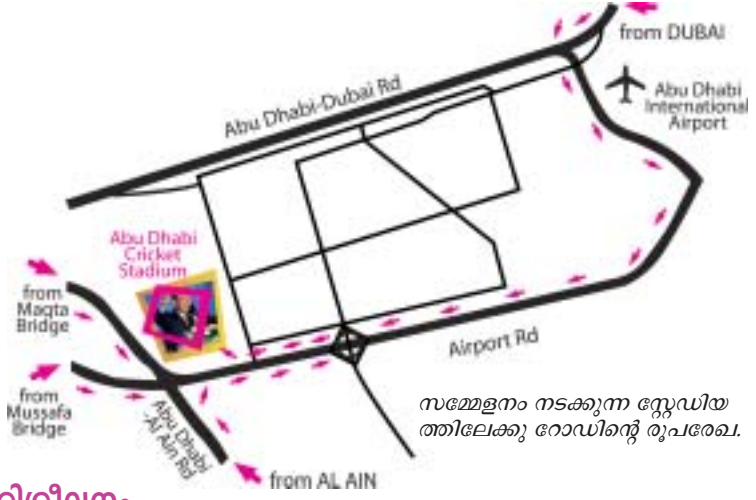
സമ്മേളനം നടക്കുന്ന സ്റ്റേഡിയത്തിലേക്കു റോഡിന്റെ രൂപരേഖ.

അബുദാബി: ക്രിക്കറ്റ് സ്റ്റേഡിയത്തിൽ നടക്കുന്ന സമാധാന സമ്മേളനത്തിന് വേണ്ടിയുള്ള പാട്ട് പരിശീലനം സെന്റ് ആൻഡ്രൂസ് ചർച്ചിൽ നടക്കുന്നു. വിവിധ ഭാഷ വർഗ്ഗ സഭാ വ്യത്യാസമന്യേ 100 അംഗ ക്യാരാണ് പരിശീലനം നടത്തുന്നത്.