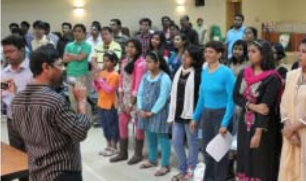
ശായകസംഘം ശാനപരിശീലനം നടത്തുന്നു.