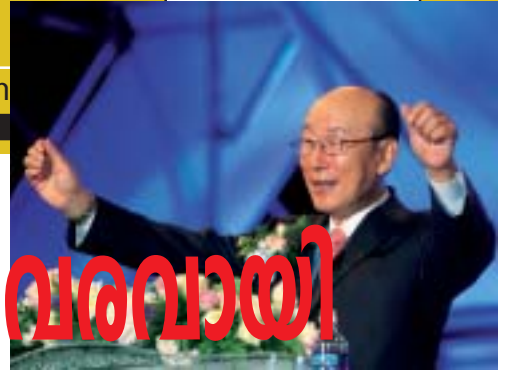
ഡോ. പോൾ യോഗി ചോ

അബുദബി: ഗൾഫിലെ ക്രൈസ്തവ ചരിത്രത്തിനു പുതിയ അധ്യായം കുറച്ചുകൊണ്ടു യു. എ. ഇയുടെ തലസ്ഥാനമായ അബുദബിയിലെ ക്രിക്കറ്റ് സ്റ്റേഡിയത്തിൽ ഫെബ്രുവരി 16,17 തീയതികളിൽ 'ഫെസ്റ്റിവൽ ഓഫ് പീസ്' ആത്മീയസമ്മേളനത്തിനു ഒരുക്കങ്ങൾ പൂർത്തിയായി. ലോകത്തിലെ ഏറ്റവും വലിയ പെന്തെക്കോസ്തു സഭയായ സൗത്ത് കൊറിയ യോഗിഡോ ഫുൾ ഗോസ്പൽ ചർച്ച് സീനിയർ പാസ്റ്റർ ഡേവിഡ് യോഗിച്ചോ പ്രസംഗിക്കും. യോഗിച്ചോയോടൊപ്പം ആറംഗസംഘവും പതിനാറിന് അബുദബിയിലെത്തും.